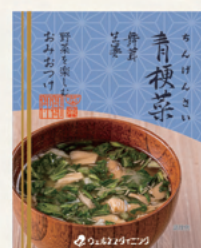
ちんげんさい 青梗菜