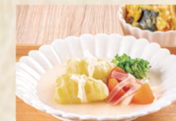
ロールキャベツ/かぼちゃ のマスタードサラダ