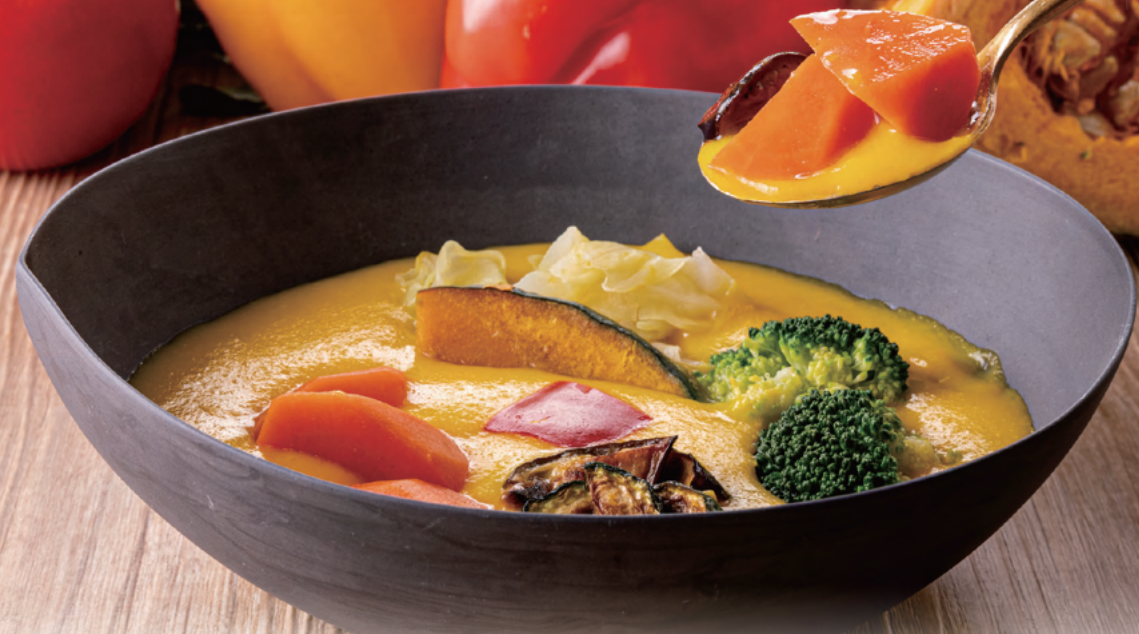
メニュー名：かぼちゃポタージュ