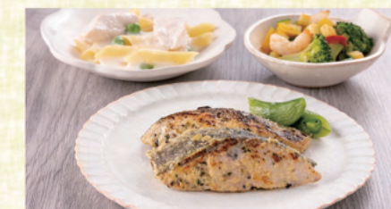
あじの香草ミックス焼き