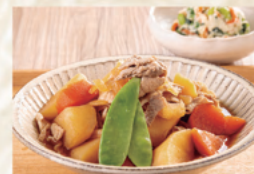
肉じゃが/彩り白和え

ご自宅で簡単に制限食が作れる”制限食料理キット” ご自分の体のため、ご家族の健康のため、様々な用途でお使いいただけます。