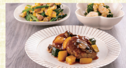
豆腐ハンバーグデミグラスソース