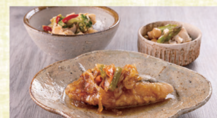
鮭の焼き南蛮漬け