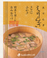
えりんぎ えりんぎ