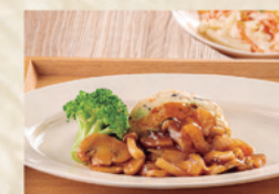
煮込み豆腐ハンバーグ/ にじんとマカロニのサラダ