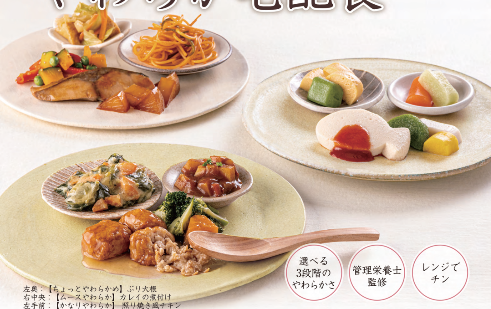
左奥：【ちょっとやわらかめ】ぶり大根 右中央：【ムースやわらか】カレイの煮付け 左手前：【かなりやわらか】照り焼き風チキン