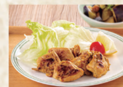
タンドリーチキン/ 揚げなすのねぎソース