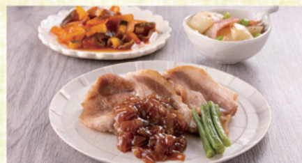
ポークソテーオニオンソース

味気ない食事ではなく、楽しみながら続けていただけるように様々なメニューをご用意しています。丁寧な仕込みや、手作りのタレなど細部にまでこだわり、栄養価だけでなく美味しさも追求しています。