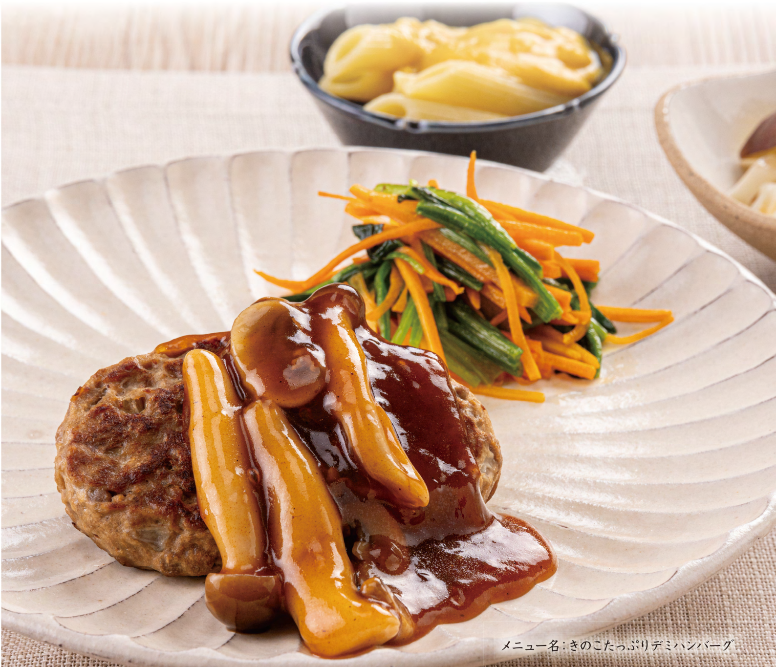
メニュー名：きのこたっぷりデミハンバーグ