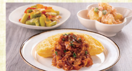
オムレツの大豆ミートソースかけ