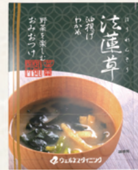
ほうれんそう 法蓮草