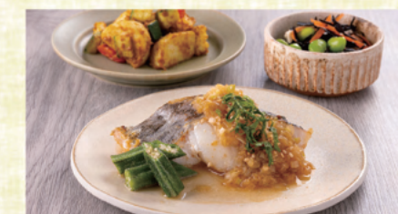
焼たらの薬味のせ