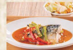
さばとパプリカのさわやか 炒め/キャベツとコーンの 中華和え